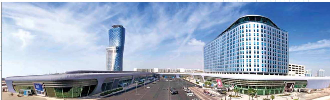
Впечатляющий масштабом, технологическими возможностями и дороговизной отделочных материалов Национальный выставочный центр ADNEC, где происходили соревнования WorldSkills