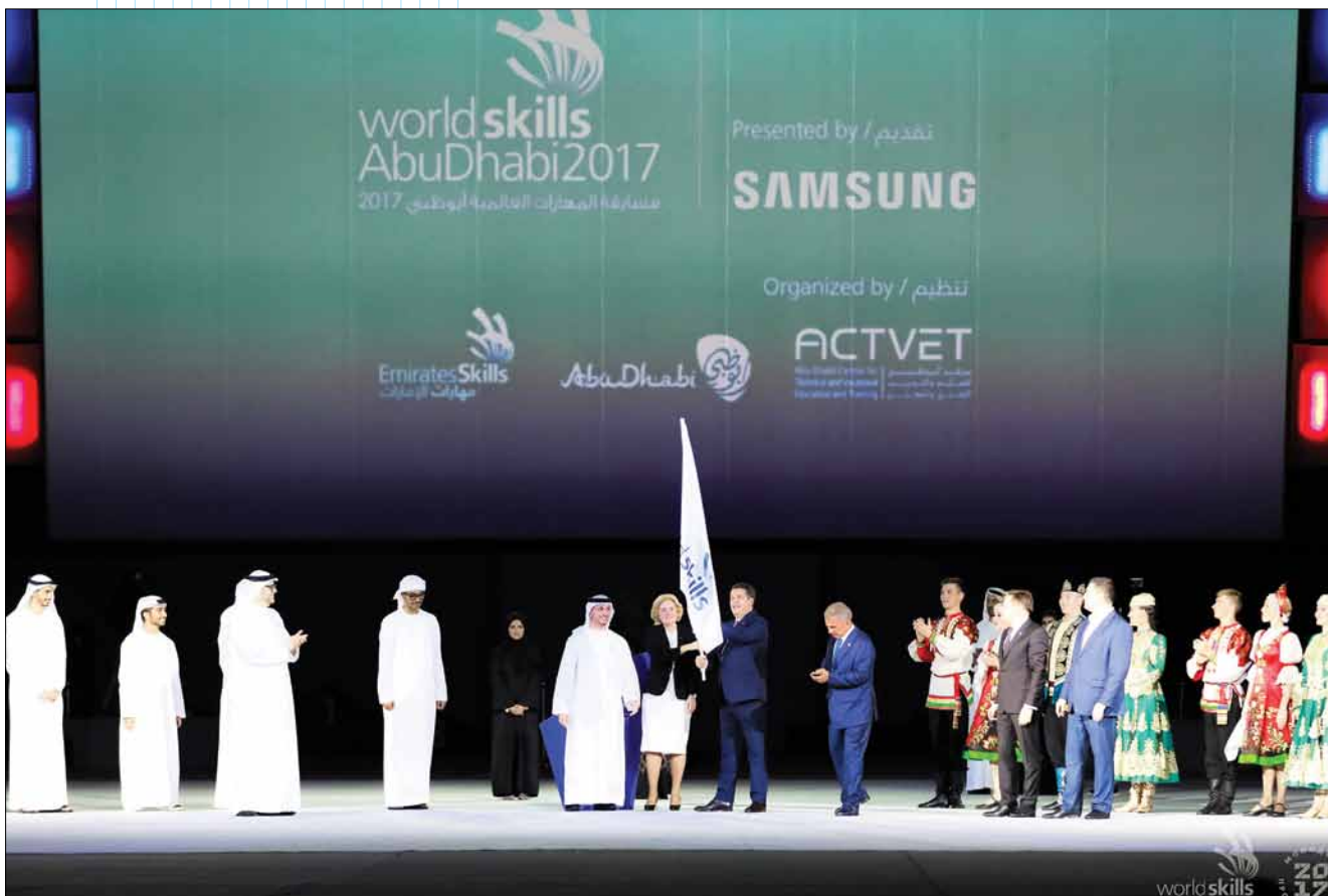
Церемония передачи официального флага WorldSkills в руки представителей России – хозяйки следующего, 45-го чемпионата

Итак, чемпионат WorldSkills Abu Dhabi 2017 успешно завершен. Впереди WorldSkills Kazan 2019! 👁