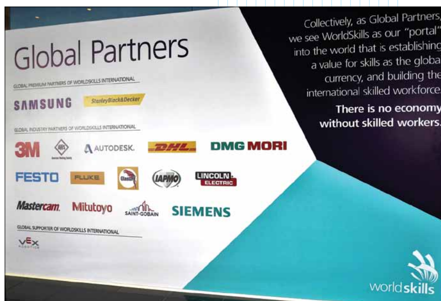
Имена глобальных партнеров говорят о серьезности мероприятия

Соревнования проходили в Национальном выставочном центре ADNEC , заняв, в общей сложности, площадь 135 870 кв.м. Всего в 51 дисциплине состязались свыше 1300 конкурсантов из 59 стран. Общее число посетителей соревнований превысило 100 тыс. человек, из которых свыше 10 тыс. прибыли из других стран.