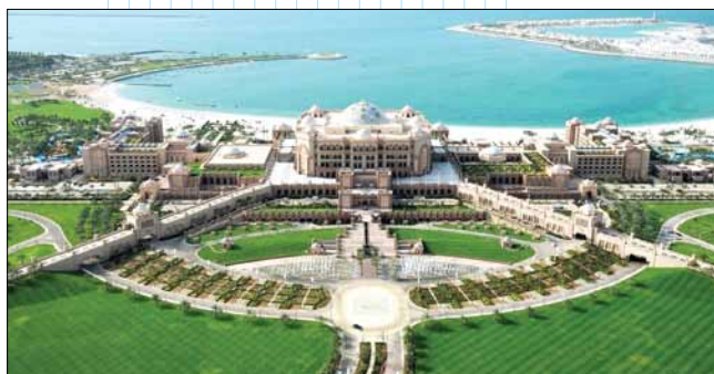
Так выглядит из окна отеля роскошный Emirates Palace

Напомним для сравнения, что на чемпионате в немецком Лейпциге в 2013 году российская команда не смогла завоевать ни одной медали и не получила ни одной поощрительной награды. На прошлом чемпионате в бразильском Сан-Паулу российская команда также осталась без медалей, но смогла продемонстрировать некоторый рост профессиональной подготовки в отдельных дисциплинах, за что была удостоена уже шести поощрительных наград ( Medallion for Excellence ).