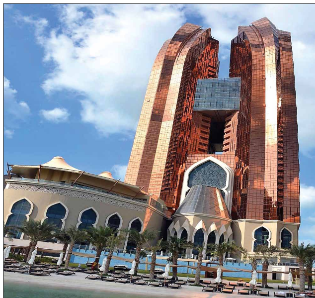
Пятизвездочный отель Bab Al Qasr экзотической архитектуры, в котором разместились делегации CNC Software/Mastercam и ГК ЦОЛЛА & COLLA