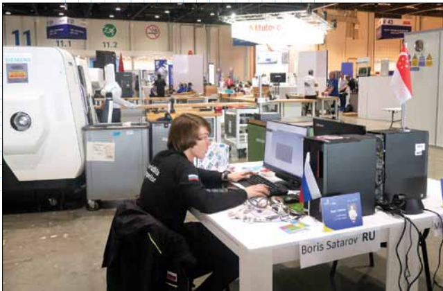
Состязания участников из 19-ти стран в компетенции “Токарные работы на станках с ЧПУ” проводились на 12-ти станках CTX alpha 500. Техподдержку со стороны Mastercam обеспечивали Dan Harris и Sitansu Mohanty